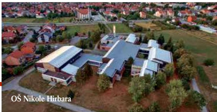
OŠ Nikole Hribara