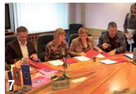
7 KOLEKTIVNI UGOVOR