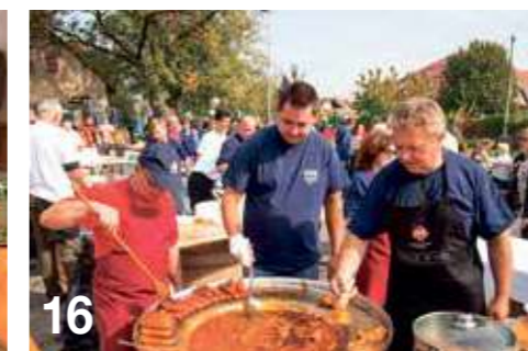
16 TUROPOLJSKI GASTRO