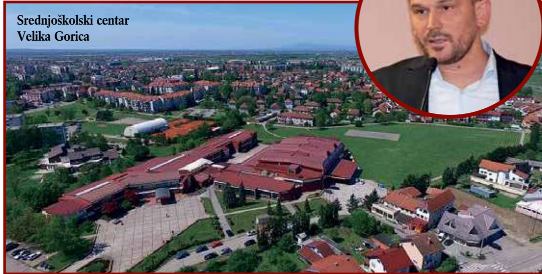
Srednjoškolski centar Velika Gorica